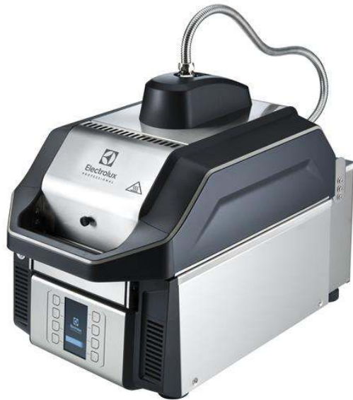
603945 (HSG3RPRSE3) SpeedDelight mit flexibler Deckplatte, gerippte, abnehmbare Teflonplatte